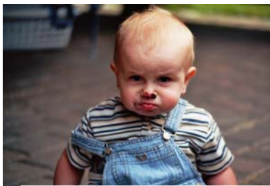
Sympathie und Vertrauen