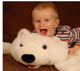
Liebe und Wärme